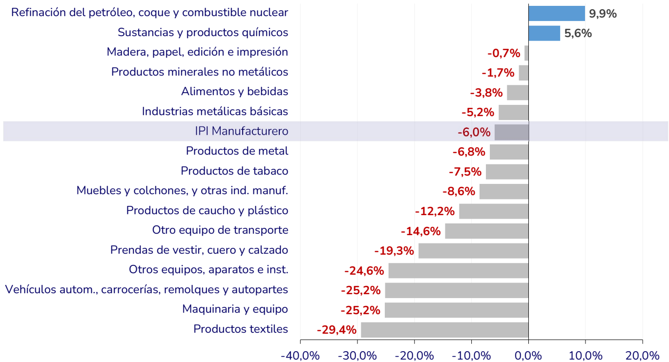
Gráfico 2. Índice de Producción Industrial (IPI) Manufacturero por sectores (variación interanual acumulada del primer bimestre de 2026 en %)