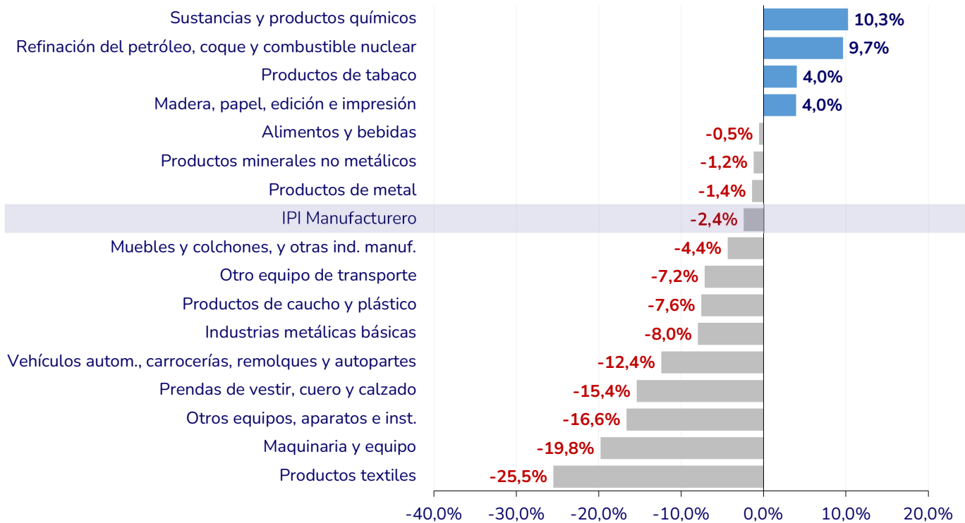
Gráfico 2. Índice de Producción Industrial (IPI) Manufacturero por sectores (variación interanual acumulada del primer cuatrimestre de 2026 en %)

Fuente: FIE en base a datos del Instituto Nacional de Estadística y Censos (INDEC). 9 de junio de 2026.